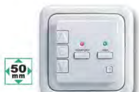
UP-Rollladensteuerung mit Funkempfänger