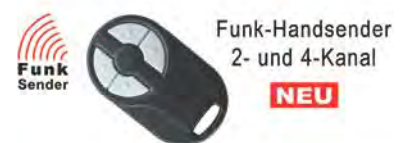
Funk-Handsender 2- und 4-Kanal NEU