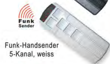
Funk-Handsender 5-Kanal, weiss