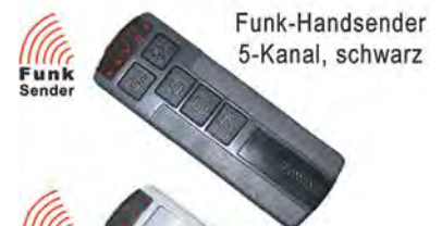
Funk-Handsender 5-Kanal, schwarz